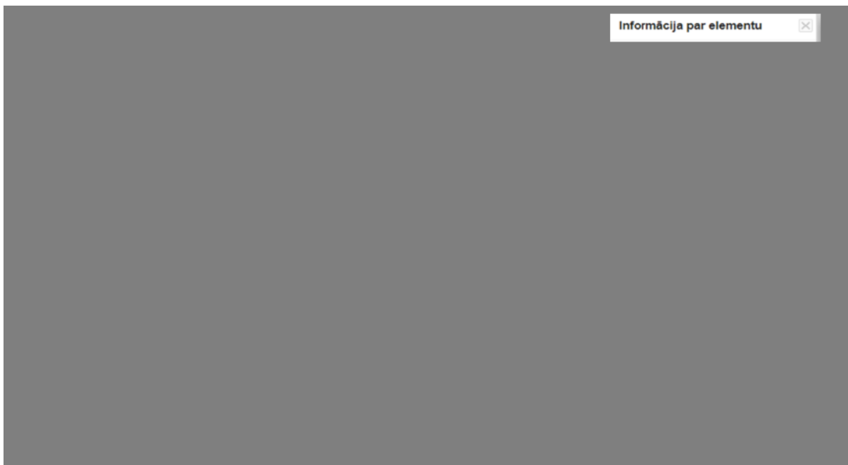
Attēls 3: SIA „Tet” starpoperatoru rīka SPRINTT kabeļu kanalizācijas sadaļas konkrēta objekta apraksts 186

Izvēloties SIA „Tet” starpoperatoru rīkā SPRINTT konkrētu vietu, kurā ir ieinteresēts alternatīvais operators, ir iespējams detalizētāk iepazīties ar informāciju par šo objektu, piemēram, īpašuma tiesībām, precīzo atrašanās vietu, posma garumu u.c. (skatīt Attēlu 3).