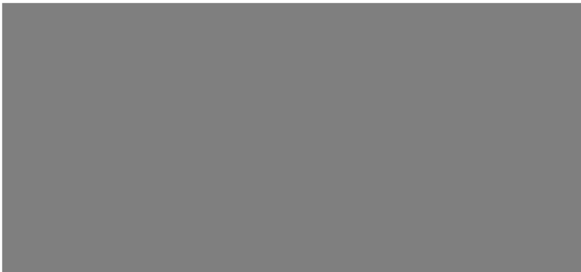
Attēls 2: SIA „Tet” starpoperatoru rīka SPRINTT kabeļu kanalizācijas sadaļa 185

Izvēloties SIA „Tet” starpoperatoru rīkā SPRINTT konkrētu vietu, kurā ir ieinteresēts alternatīvais operators, ir iespējams detalizētāk iepazīties ar informāciju par šo objektu, piemēram, īpašuma tiesībām, precīzo atrašanās vietu, posma garumu u.c. (skatīt Attēlu 3).